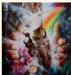
Schat in aarde kruik