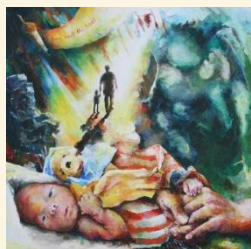
Verlies van een kind