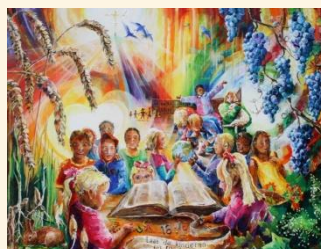
Laat ze tot Mij komen