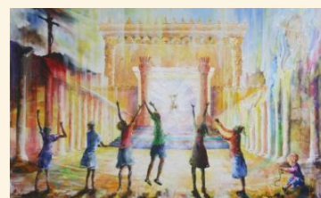
The Holy City